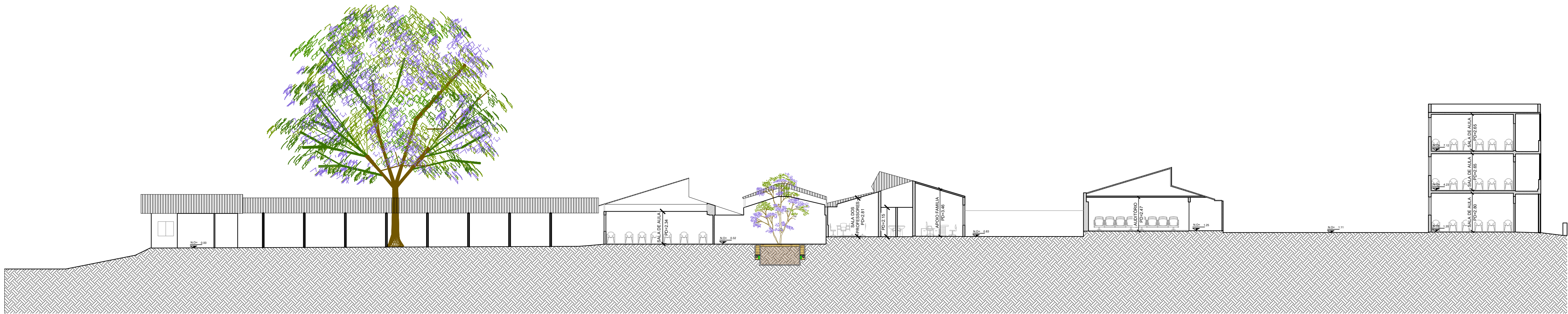
CORTE A - BLOCO 1, BLOCO 2, BLOCO 3 ESC: 175